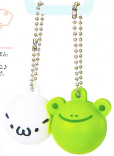
※ボールチェーン付 顔文字くん3Dキーカバー ¥630(¥600) U:3 C/T:200 M:ラバー S:φ35mm MADE IN CHINA