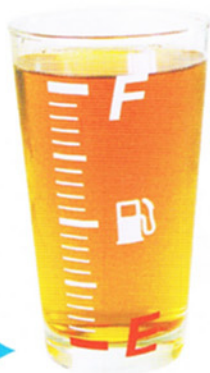
飲み物を入れた状態