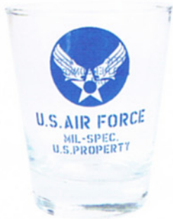
AR-1327-1 AIR FORCE/327912