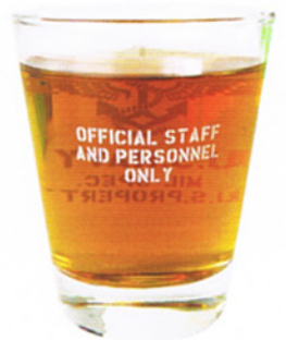
BACK (飲み物を入れた状態)