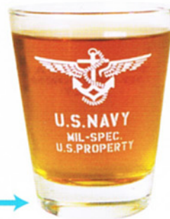
飲み物を入れた状態