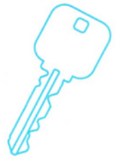
※ボールチェーン付 アニマル3Dキーカバー ¥630(¥600) U:3 C/T:200 M:ラバー S:φ35mm MADE IN CHINA