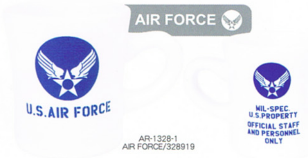
AR-1328-1 AIR FORCE/328919

アメ雉の定番! ミリタリーグッズの紹介です。今回はグラスとマグ♪それぞれシンプルだけど、ドンとはいったロゴマークがカッコいい! 空軍、陸軍、海軍と揃えています♪是非どうぞ♪